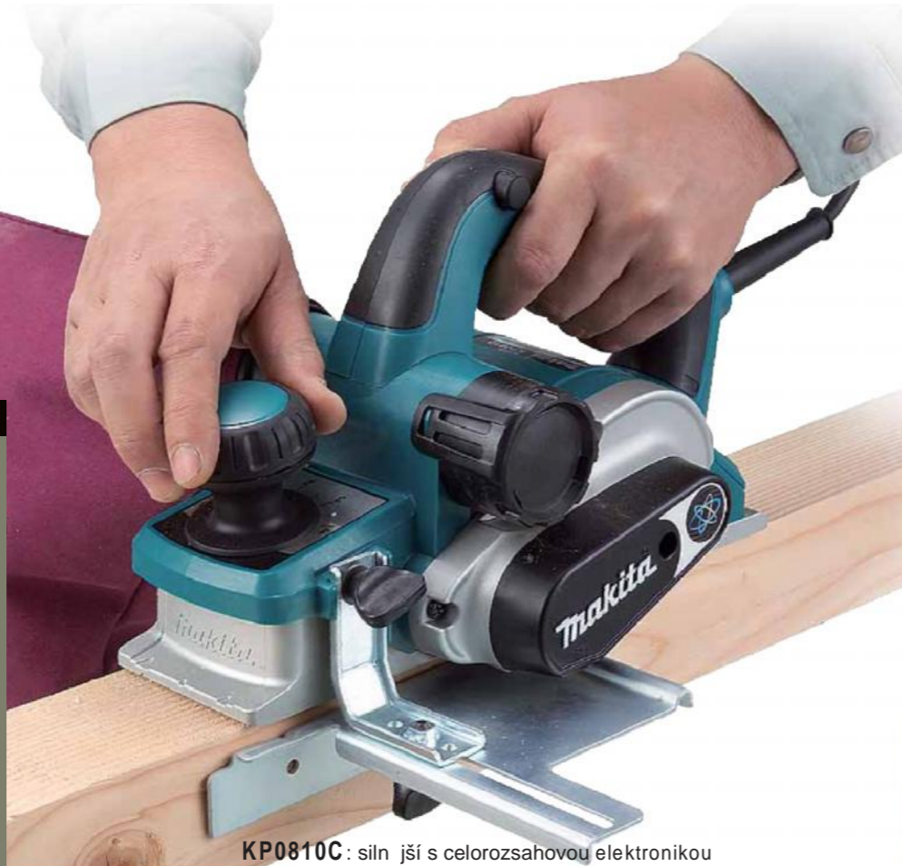
KP0810C: siln ější s celorozsahovou elektronikou